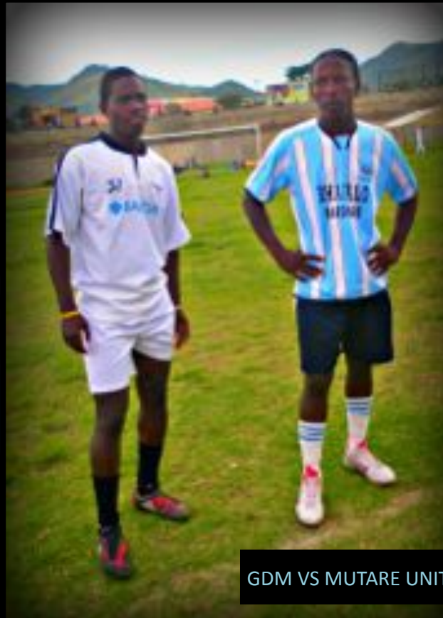
GDM VS MUTARE UNITED