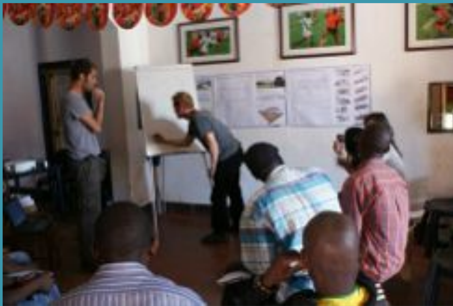
FFH com a comunidade a desenvolver as ideias do novo centro.