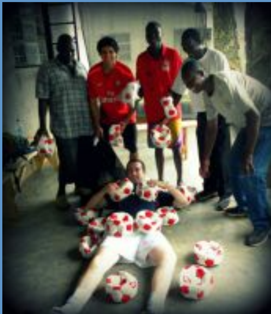
A celebrar a vinda das bolas mandadas pelo Arsenal na Inglaterra.