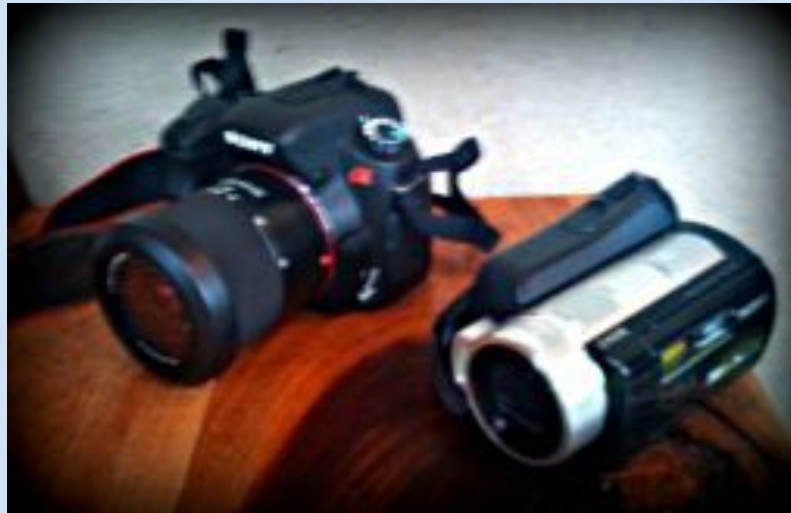
2 das 3 maquinas oferecidas da SONY